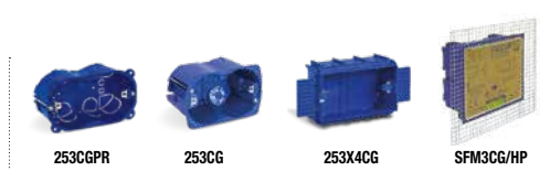
Pareti in cartongesso Hollow walls