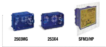
Pareti in muratura Brickwork walls