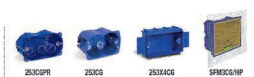
Pareti in cartongesso Hollow walls