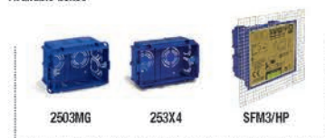
Pareti in muratura Brickwork walls