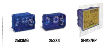
Pareti in muratura Brickwork walls