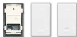
45302ST 45B02 45B02G