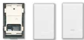
45301ST 45B01 45B01G