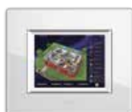
TS03B-V + 44PV12BL