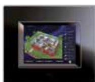
TS03N-V + 44PV12NAL

Touch screen DOMINApplus 5.7" con audio integrato – Frontale bianco lucido